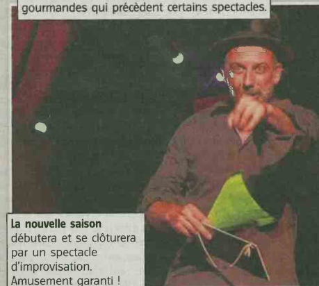
La nouvelle saison débutera et se clôturera par un spectacle d'improvisation. Amusement garanti !